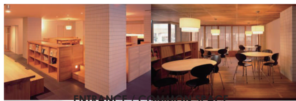
ENTRANCE / COMMON SPACE

運営会社：株式会社 S-FIT E-mail : gakusei@sfit.co.jp