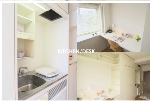
KITCHEN / DESK