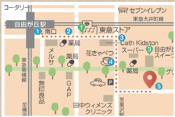
自由ヶ丘までの道のりです。