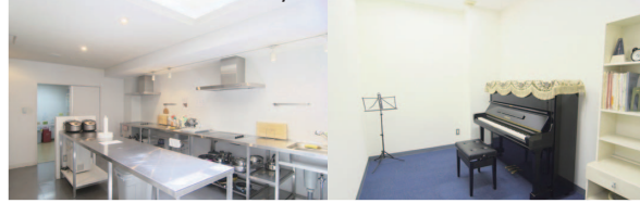
ピアノレッスンルームがございます。