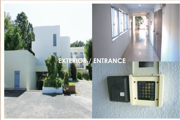
EXTERIOR / ENTRANCE