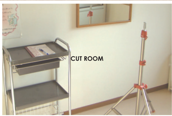
美容系の学生様へ。 カットの練習ができます。