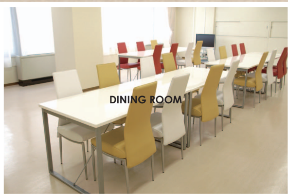
明るく、清潔感のある食堂。