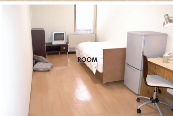
和室タイプのお部屋もございます。