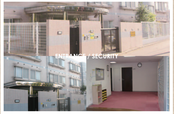
ENTRANCE / SECURITY