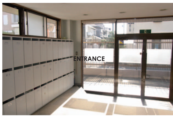
広々明るいエントランス。

運営会社：株式会社 S-FIT E-mail : gakusei@sfit.co.jp