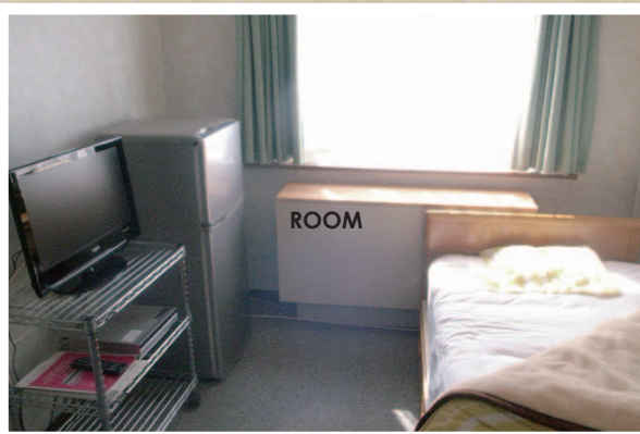
出窓付の明るいお部屋。