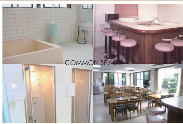
食堂内にミニキッチン。 お料理を作ることもできます。