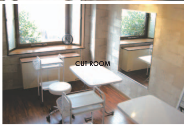
理容美容系学校に通われる方、 カット練習ができます。